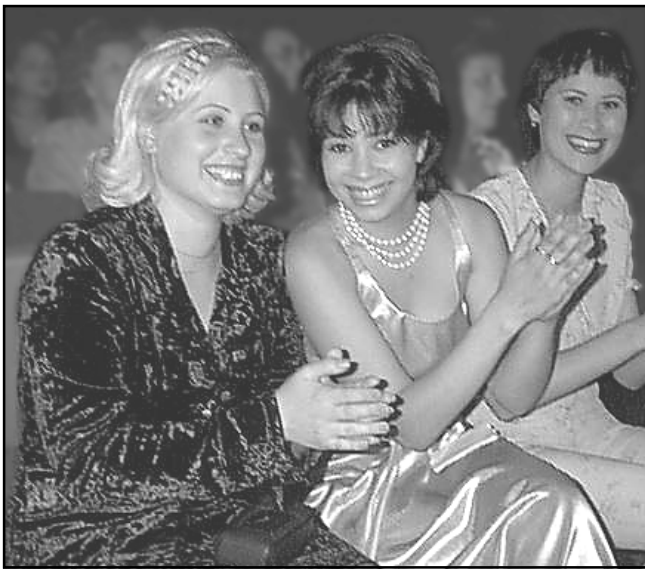
Выпускной вечер в Качканарском техническом лицее.